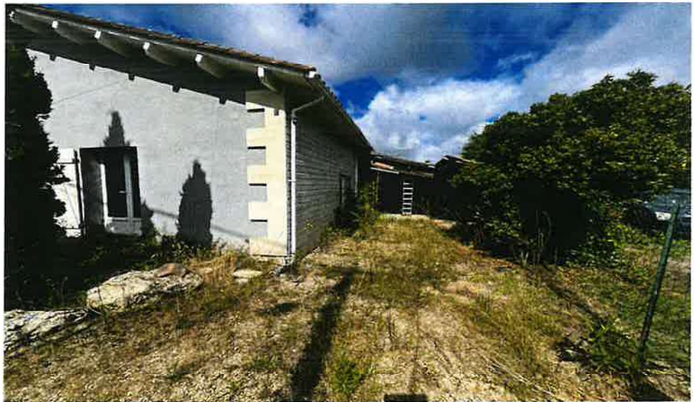
Auvent attendant coté est, très vétuste cité pour mémoire.